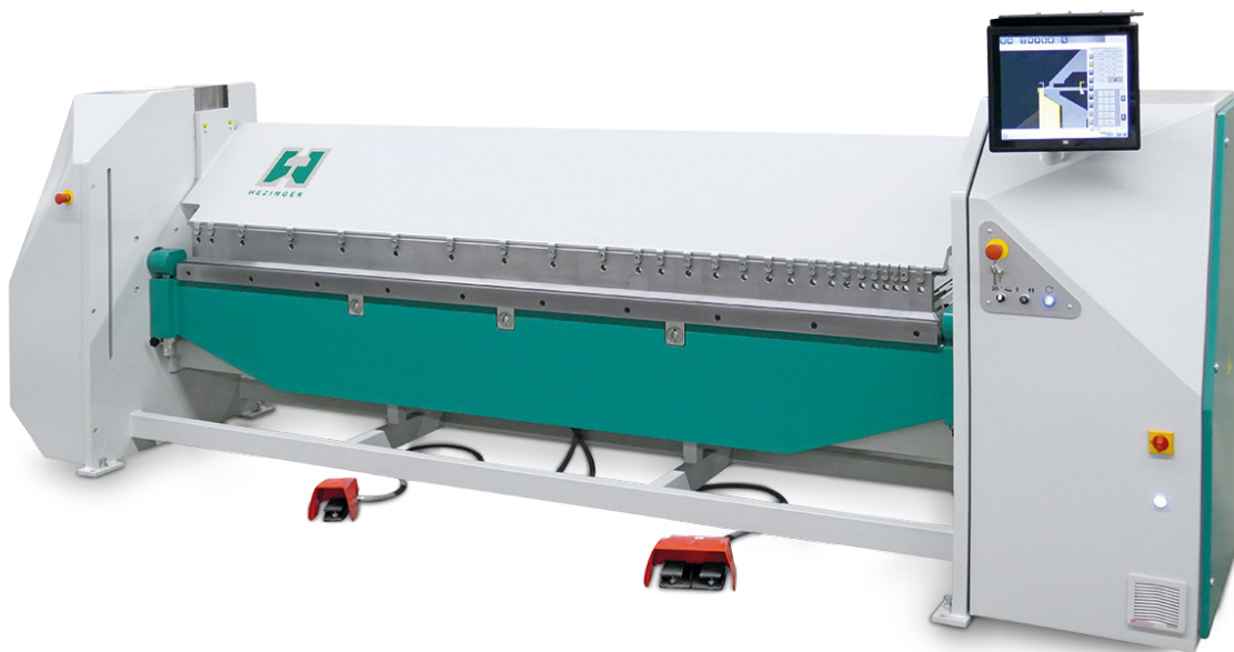
Beispiel PTSL-3100-30 mit grafischer Steuerung