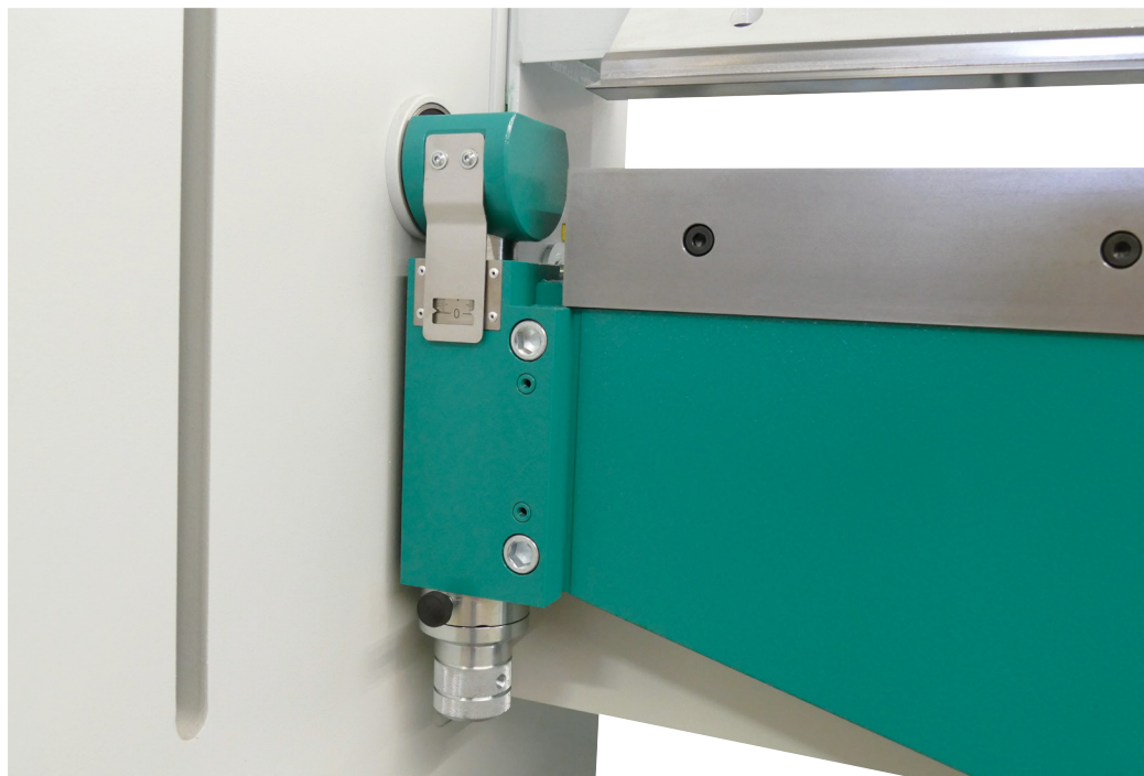
Einstellung des Biegeradius über Drehnocke

Bei den PTS-Modellen verfügt die Maschine über eine gesteuerte Z-Achse, die für die Klemmung zuständig ist. Dies bietet eine höhere Genauigkeit und Flexibilität bei der Positionierung und Anpassung des Werkstücks und erleichtert komplexere Biegeoperationen.